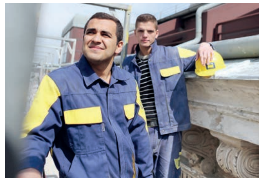
Mit Erasmus+ können Lehrlinge ein Praktikum im Ausland absolvieren.

Lehrlinge ab 16 Jahren, die idealerweise schon das zweite Lehrjahr absolviert haben, können sich beim IFA bewerben und Fördermittel für ein Praktikum im Ausland beantragen. In den meisten Fällen deckt die Förderung nicht die Gesamtkosten des Praktikums. Bei einem drei bis sechswöchigen Aufenthalt ist mit einem Selbstbehalt zwischen 200 und 650 € zu rechnen.