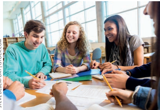
Bei der Bildungsinitiative diskutieren Jugendliche über Werte wie Menschenrechte und was diese für ihr Leben bedeuten.

Unter den Unterstützern der Bildungsinitiative befinden sich auch Prominente wie Conchita Wurst und Lara Gut.