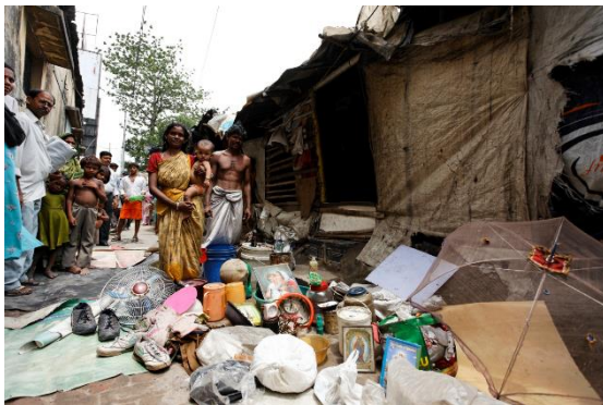
Familie in Indien