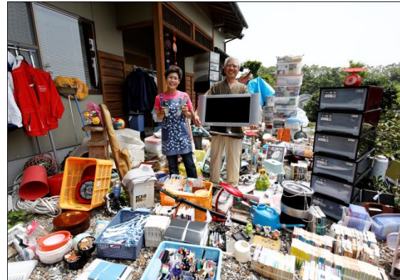
Familie in Japan