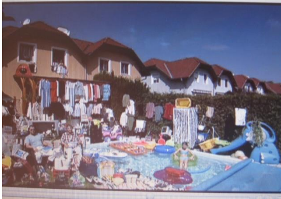
Familie in Österreich