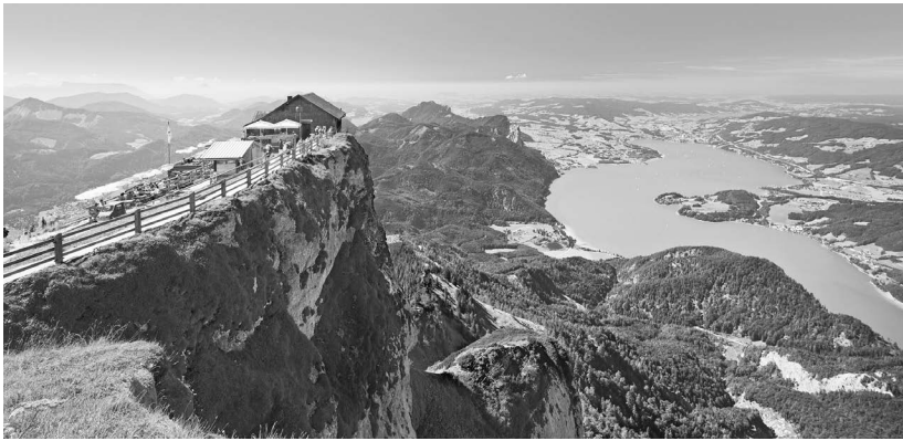
ÖSTERREICH WERBUNG | RAINER MIRAL

1. Lesen Sie den Artikel „Sommerfrische statt Hawaii“ auf Seite 4. Suchen Sie alle Sommerfrische-Orte, die im Artikel genannt werden und schreiben Sie sie auf.